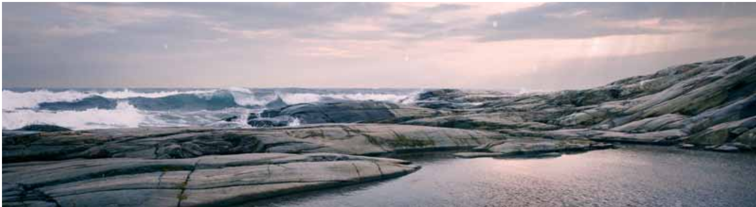
Glattskurte svaberg på Justøya i Lillesand.

kommunene Asker, Bærum og Drammen. Avtalen har et årlig volum på om lag 220 GWh.